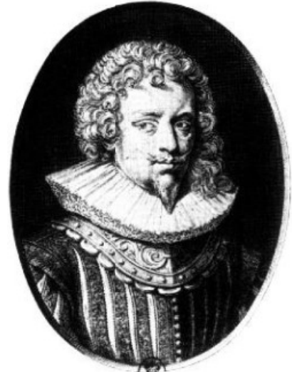
Charles 1 er De Créquy